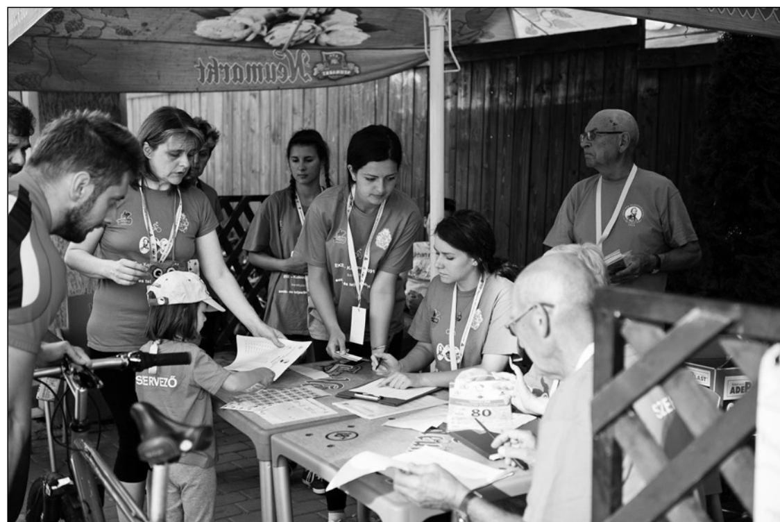
Indítóiroda Gyaluban – generációk vállvetve dolgoznak