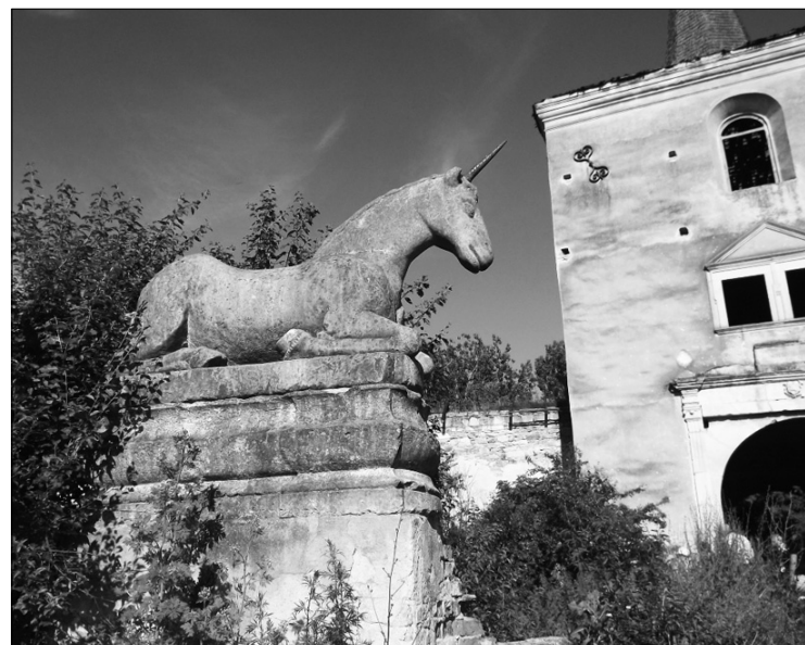
A többnyire romos Kornis-kastély épőbb része Szentbenedeken