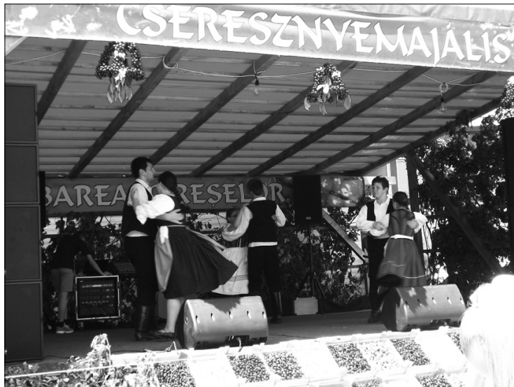
Az első cseresznyefesztivált 1893-ban szervezték

Az első feljegyzések erről a településről 1269-ből származnak, amikor Dycha néven jelenik meg, de feltételezhető, hogy már az ókorban lakott volt, ugyanis régi pénzérméket találtak, vas-tag, nem korongon készült csepepek között. A falu három pala-