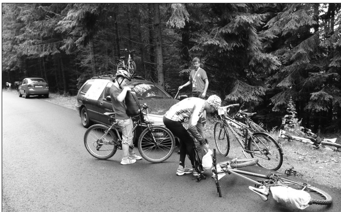
Matricagyűjtés a tóparti ellenőrzőpontnál