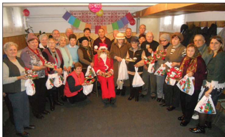
Klub minden kedden, a templom alagsori nagytermében

„Vénségetekig ugyanaz maradok, ősz korotokig én hordozlak! Én alkottalak, én viszlek, én hordozlak, én mentelek meg.” (Ézs 46,4) – hangzott az igei bizonyágtétel november 26-án, Idősek Vasárnapján.