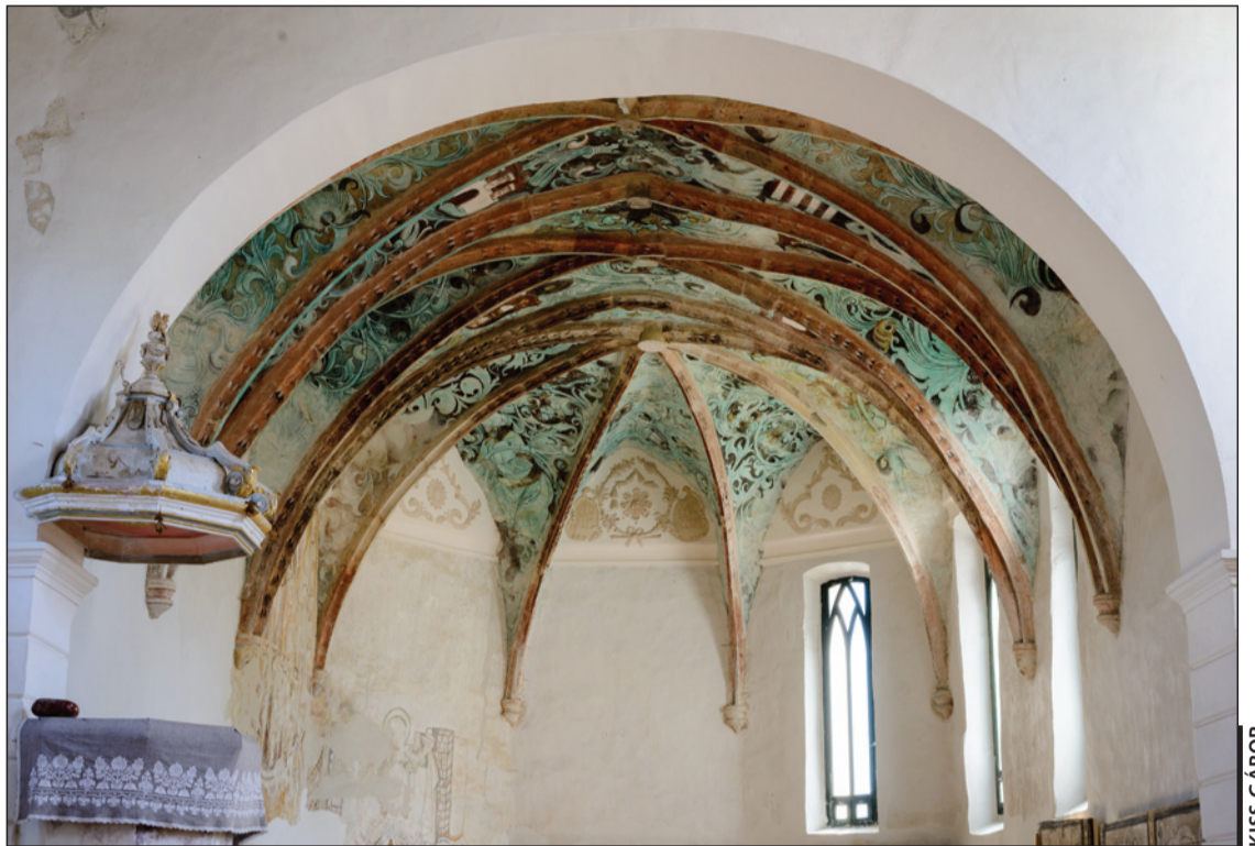
A székelydályai templom különleges freskói

– Amelynek leggyakrabban emlegetett mondata: a hit Is-