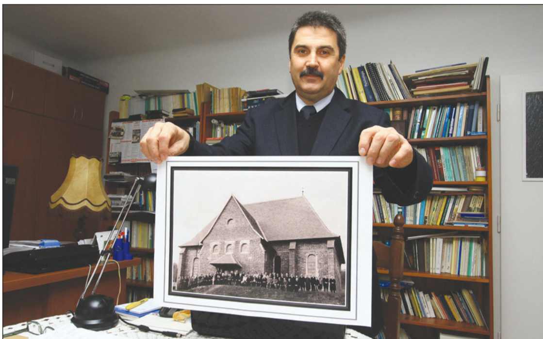
Csak torony nélkül engedték a templomépítést

– A házaknál tartott istentiszteletek alatt született meg az igény arra, hogy templomot építsenek. Ekkor összevásárolták a szükséges területeket, a Kajántói út 101. és 109. szám közti kicsi telkeket. Kós Károly és Debreczeni László tervei alapján 1949 és 1955 között épült fel a templom, amely a mai napig nincs kész: a kazettás része még mindig nincs befejezve. A templomot 1957-ben Vásárhelyi János püspök szentelte fel. Az állami szervek december elsejére, román ünnepre tűzték ki a templomszentelés dátumát. Egészen megerőltető volt a gyülekezet számára a templom felépítése, hiszen földműves és kiskeresetű emberek laktak itt, segítségükre siettek rengeteg közmunkával a Hidelvén és a Kerekdombon lakók – mondta a lelkész.