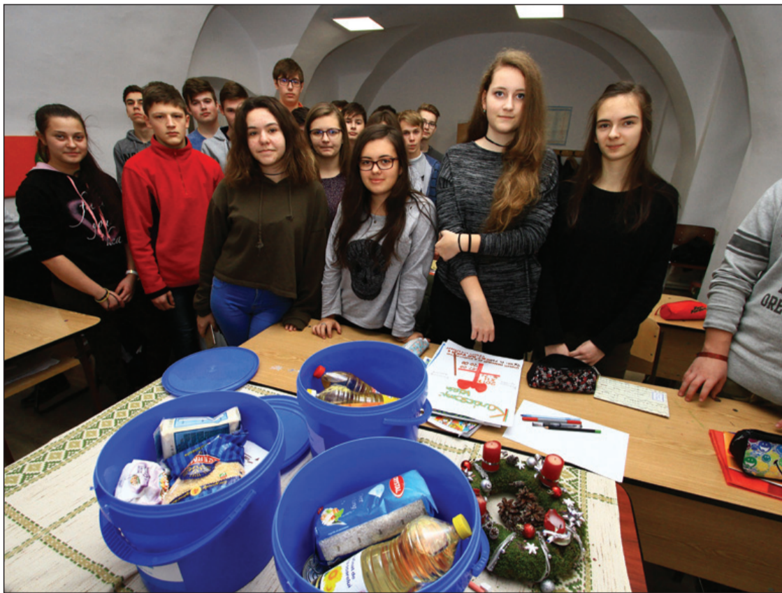
A kék veder tartalma bármi lehet, de egyvalaminek biztos kell lennie benne: szeretetnek