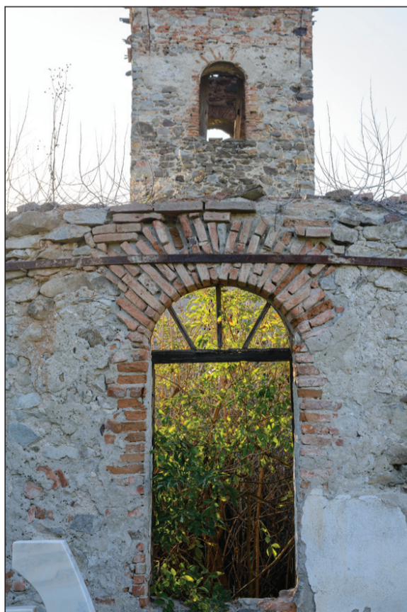
A Hunyad megyei Kristyor romtemploma