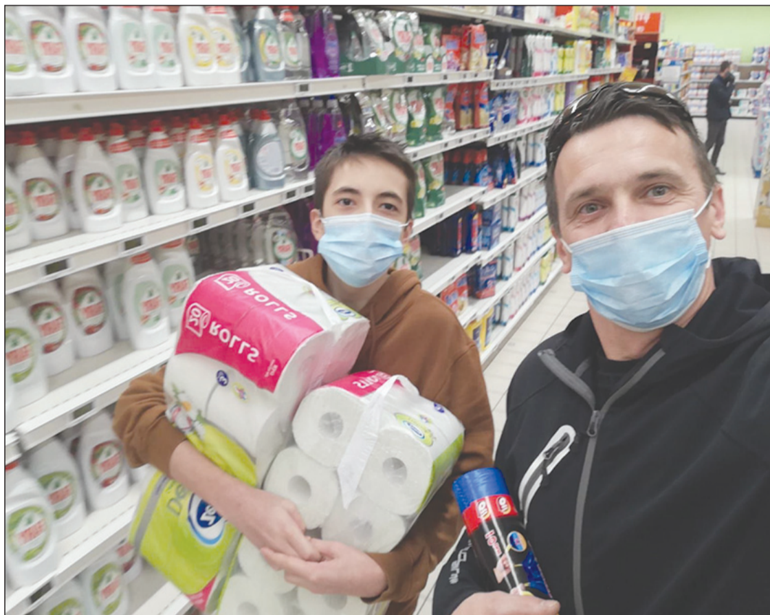
Beszerezőúton két törökvágási önkéntes, apa és fia

Ha a falu egyetlen kisboltja csak néhány órát van nyitva, ha megszűnt a buszjárat, akkor fokozottan elkel a segítség a járvány idején. A lelkipásztorok telefonon „látogatják” a híveket, vidéken a szomszédok segítenek egymáson ahogy tudnak, városi környezetben a diakóniai csoportok tevékenykednek. Természetes, hogy az egyház jelentős szerepet vállal ebben, hiszen a falvakban sok esetben az egyház az egyetlen helyi hatóság, intézmény, még akkor is, ha csupán a lelkipásztorból, annak családjából és az önkéntes segítők-ből, gondnokokból áll. A kommunikációt, a nagyon szükséges lelki támogatást nehezíti, hogy vidéken nincs vagy rossz lehet az internetkapcsolat, illetve az idősek nem is tudják használni. Segítőkön túl kreatív ötletekre is szükség van ahhoz, hogy a magányosokat, betegeket, időseket hasznosan segíteni lehessen. Kidében közel egy évszázad után újraindították a két világháború között alapított gyülekezeti lapot, egyesek telefonon hallgatják az istentiszteletet. (Részletek a 6. oldalon)