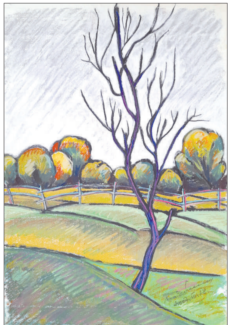
Szilvafa ősszel, pasztell, 2007

(A kiállítás április 20-ig látogatható, hétköznap 9–16 óra között, hétvégén csak előzetes egyeztetéssel.)