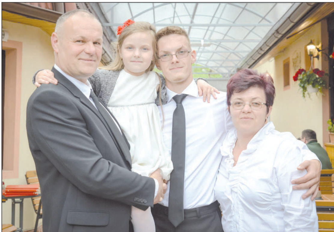
Az egész család kiveszi a részét a templom körüli teendőkben és a mezőgazdasági munkából

– Az egyedüli cél, és ez az én hitvallásom, Istent dicsérni és magasztalni, amíg élek!