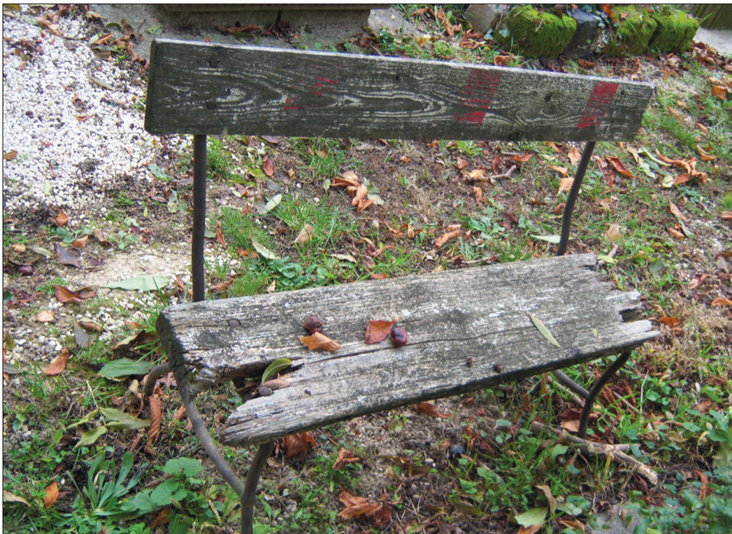
Elmulás. A passzív eutanáziát nem utasítja el a református egyház

Azok az emberek, akik Isten nélkül szemlélik a világot és élnek az életüket, abban a helyzetben, amikor eutanáziáról beszélhetünk, nagy bajban vannak. Az istenfélő embernek ebben a mélységben is, ahova már szeretteik nem kísérhetik, van kihez fordulnia. Maga mellett tudhatja Istenét, aki teremtője, gondviselője és megváltója, egyszermind tulajdonosa is. Nem arról van szó, hogy az istenfélő emberek mind jók, az istentagadók vagy közömbösek pe-