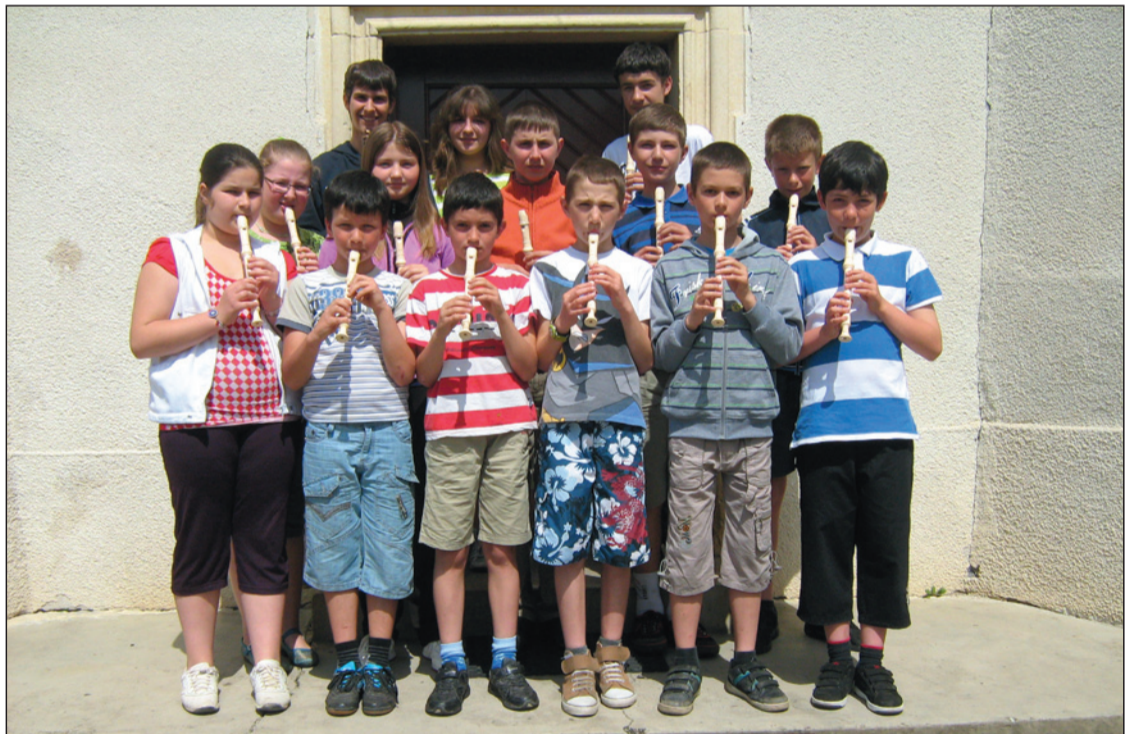
Ötéves a Flautino