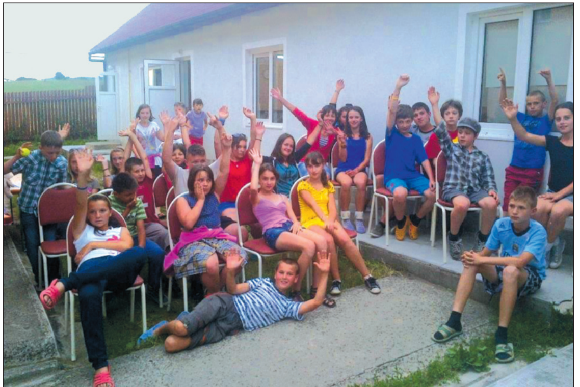
Jól sikerült táborozás a bogártelki gyülekezeti házban