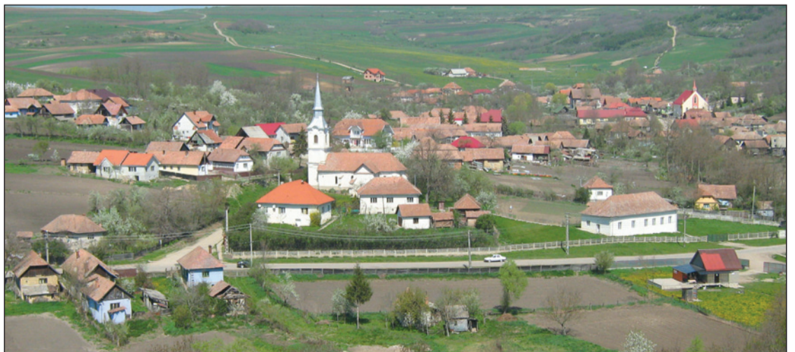
„A só elraktározására szolgáló hely”