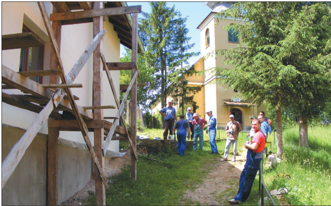
Június 9-én avatják a mintegy 130 éves parókia felújított épületét

A reformáció századaiban a falu – a közeli Kolozsvárra jellemző módon – előbb a lutheri irányt, rövid ideig az unitarizmust, majd a kálvini irányt követte a földesurak döntései szerint. A falu felekezeti hovatartozását mégsem a cuius regio, eius religio (akié a vidék, azé a vallás) elve döntötte el, mert a 18. század közepén gróf Haller Györgynek sikerült ugyan visszavenni az Árpád-kori templomot, de a falu lakosságának többsége – a 33 évig tartó megfélemlítések, megaláztatások ellenére is – megmaradt reformátusnak. Rekatolizációval „fenyegették” ugyan az 1793-as dévai zsinatot, de csak azért,