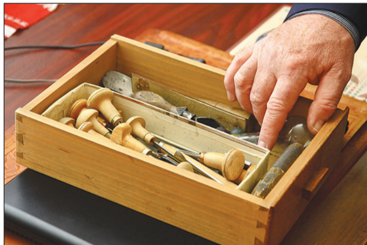
Egy-egy vésőt egy egész este fent, hogy a metszéshez megfelelő éle legyen

– Az első nagyméretű dúca a Fáramászó volt. Ez annak apropóján született, hogy egy 1932-ben szervezett kiállításán találkozott Kós Károllyal, aki azt kérdezte tőle: fiatalember, miért nem mászik fára? A fára mászást persze nem szó szerint értette, hanem arról faggatta, miért nem készit fametszeteket – mesélte Gy. Szabó Béla első