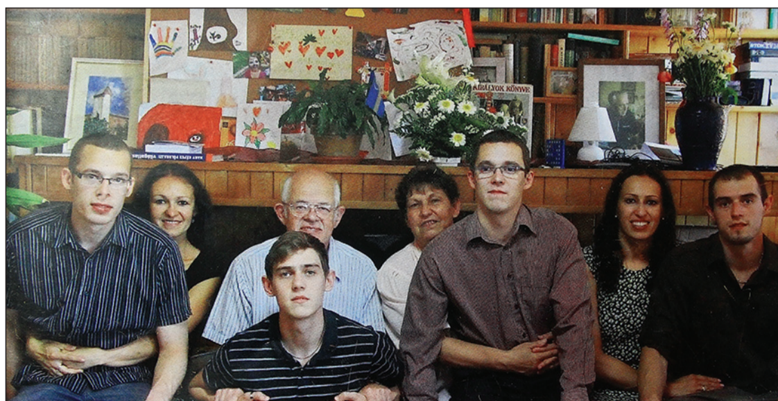
Családi fotó, 20 év különbséggel