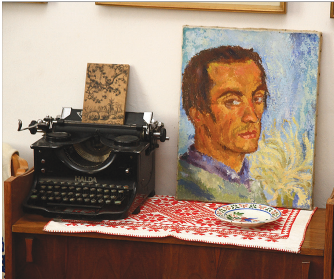
Személyes tárgyak, nemcsak képzőművészeti alkotások tárháza az emlékszoba