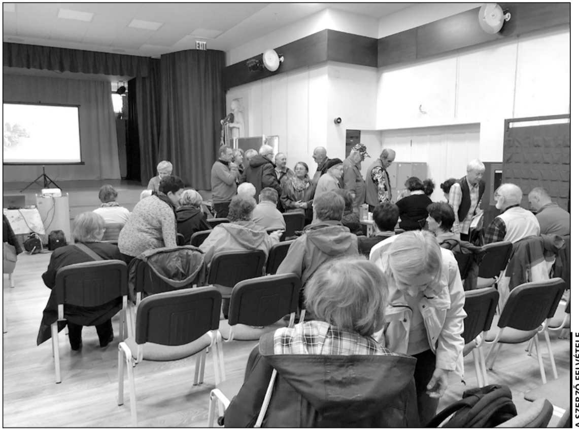
Gyülekeznek a tisztújító közgyűlés résztvevői