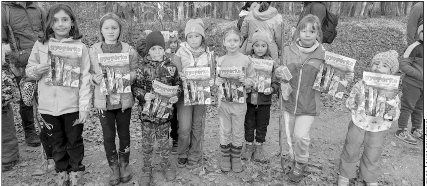
A résztvevők a felejthetetlen élmények mellett Gyopárkával is gazdagodtak