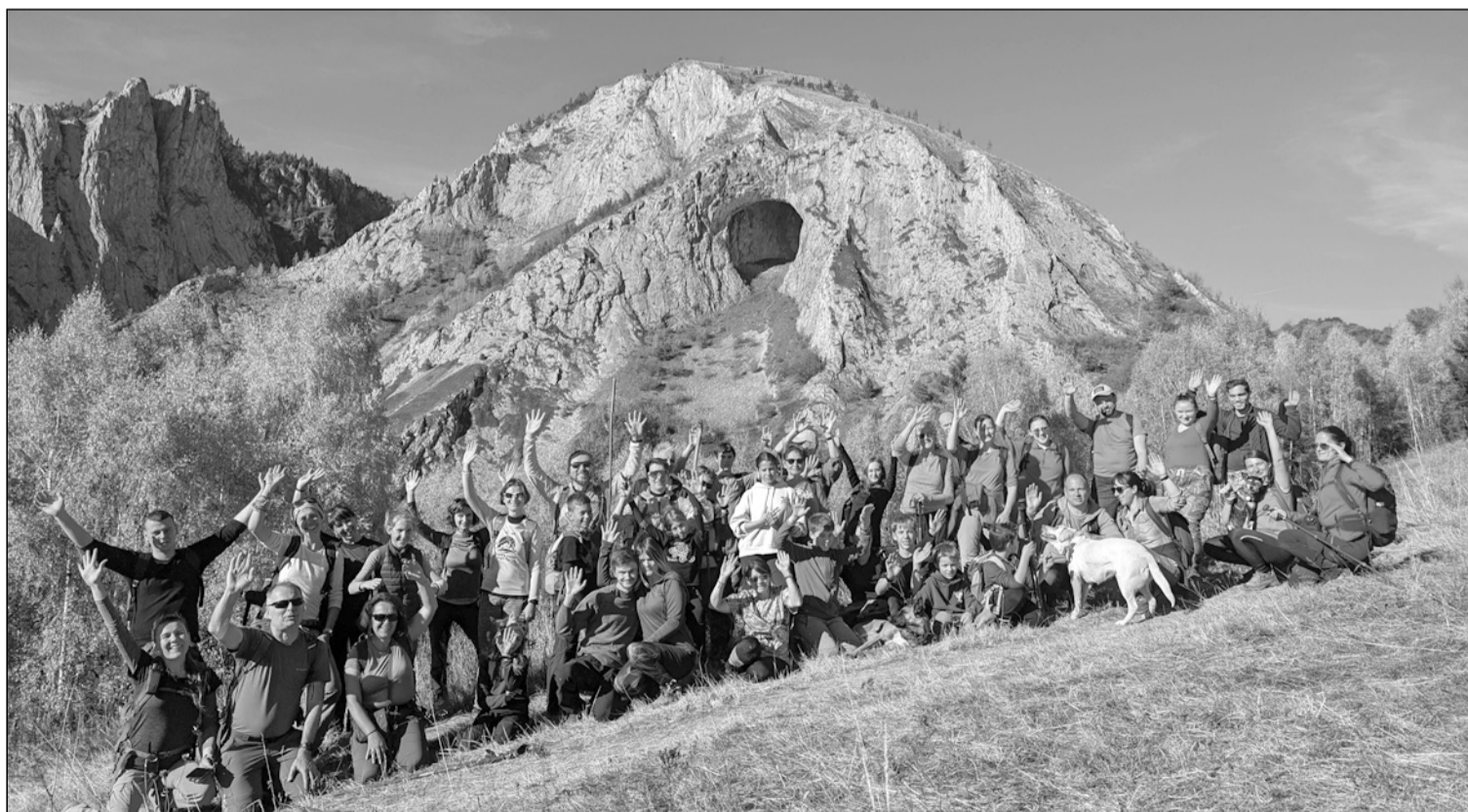
Vidám csapat a Bélavára túrán, háttérben a látványos Coșul Boului barlang

A fehér törzsű, aranyba öltözött, kecses nyírfák büszkén pompáztak az októberi napfényben, így a följük magasodó sziklaformáció még magasztosabbnak hatott, mint az év többi részében. A kötelező csoportkép után mindenki kényelmesen elhelyezkedett a fűben: egyesek elfogyasztották a még megmaradt uzsonnájukat, mások napfürdőztek, sokan pedig elmerültek az októberi színekavalkádban tündöklő természet szépségében. Folytatva utunkat, még egy utolsó pillantást vetettünk a robusztus sziklafalakra, majd fokozatosan visszaereszkedtünk túránk kiindulópontjához. Legnagyobb meglepetésünkre reggel óta annyira felduzzadt az autók száma, hogy a keskeny út széle tele volt parkoló kocsikkal. Az elmúlt két évben sosem láttunk itt ennyi embert, viszont nem is annyira meglepő, hiszen csodás időt jeleztek erre a hétvégére, a Bélavára pedig ilyenkor ősszel a leglátványosabb. Bár népes csapattal vágunk neki a 10 km-es útvonalnak, amely 800 m teljes szintemelkedést tartogatott számunkra, nagyon jó tempóban haladtunk, kicsivel négy után vissza is értünk járműveinkhez. Útban hazafele elraktároztuk mindazt a csodát, amelynek szemtanúi voltunk, hogy a szürke, hideg, esős napokon elővarázsolhassuk az októberi színekavalkádot.