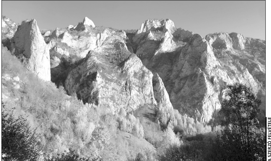
A napfényben fürdőző, fehérén virító mészkőfalak látványa fogadott már a túra elején

A La Răscruce-nyeregben találoztunk a Kisbányahavas felé vezető kék kereszt jelzéssel, mi viszont a piros pöttyön folytattuk utunkat nekifeszülve az utolsó nagyobb emelkedőnek. Amint felfele kaptattunk, néha vissza-visszanéztünk s megpillantottuk az Öreghavas (1826 m) laposan elnyúló platóját, de a Buszkát és a Gyalui-havasok további csúcsai is vissza-köszöntek. A Királyok fennsíkján hosszú ebédszünet következett, majd a csapat egy része kísélt a közelben levő kilátóra, ahonnan teljesen más perspektívából csodálhattuk meg a különleges sziklaképződményeket. A Bleánc-csúctól (Colțul lui Bleant) jobbra, kissé távo-