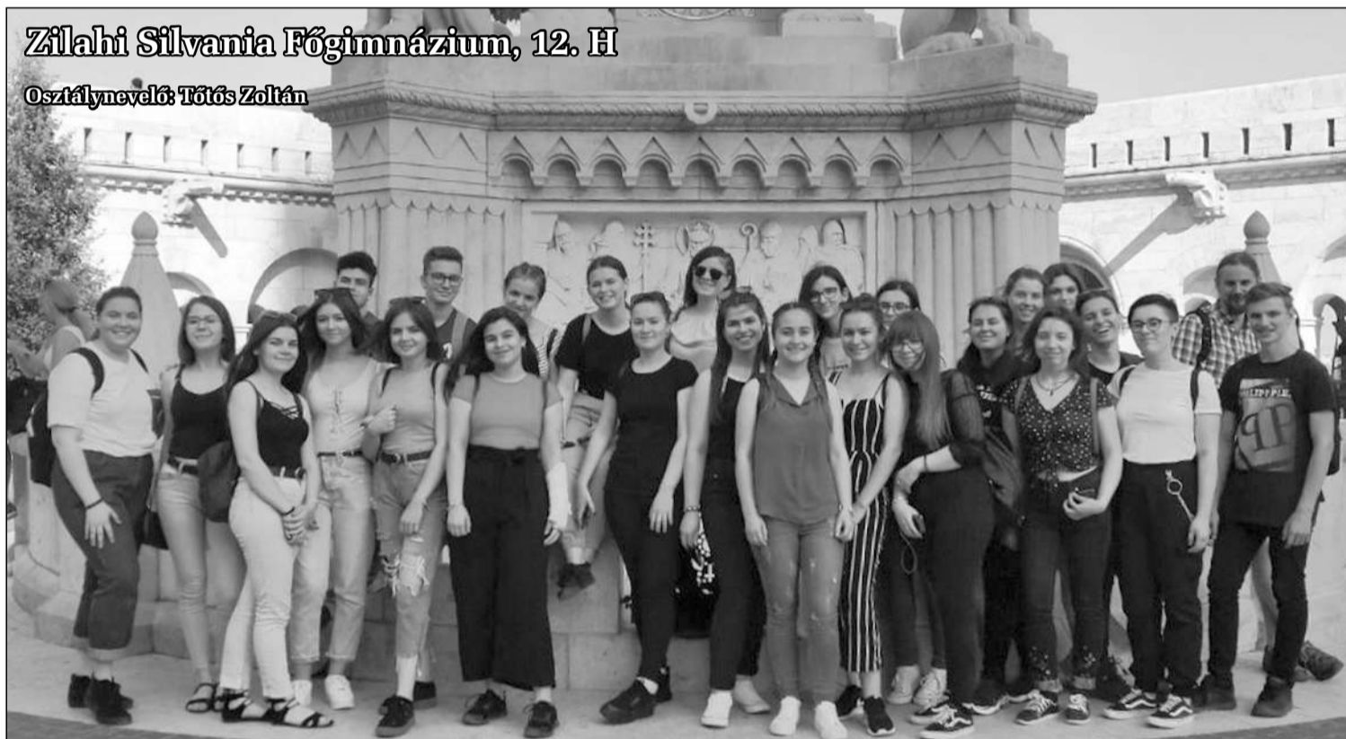
„Utad értelme nem a cél, hanem a vándorlás.” (Márai Sándor)