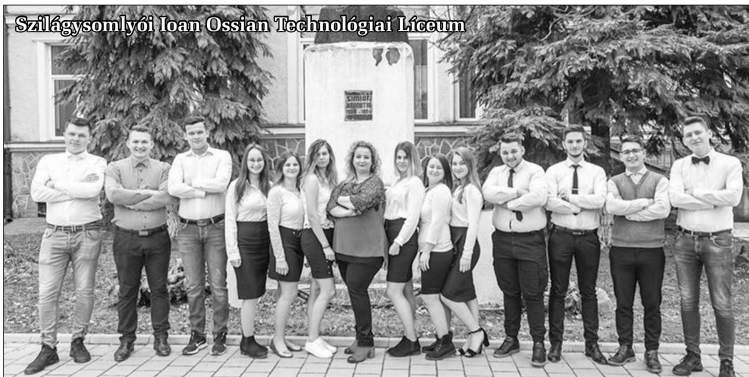
Szilágysomlyói Ioan Ossian Technológiai Líceum