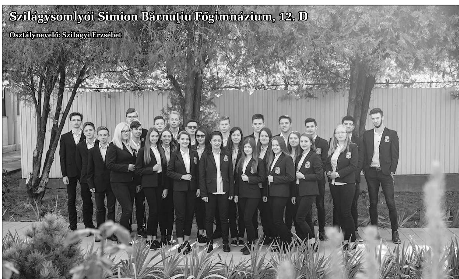
Szilágysomlyói Simion Bărnuțiu Főgimnázium, 12. D

„Induljunk vígan és remélve, / A boldog, szép jövő elébe / Miénk a föld a nap alatt / Míg szívünk bátor és szabad.” (Juhász Gyula)