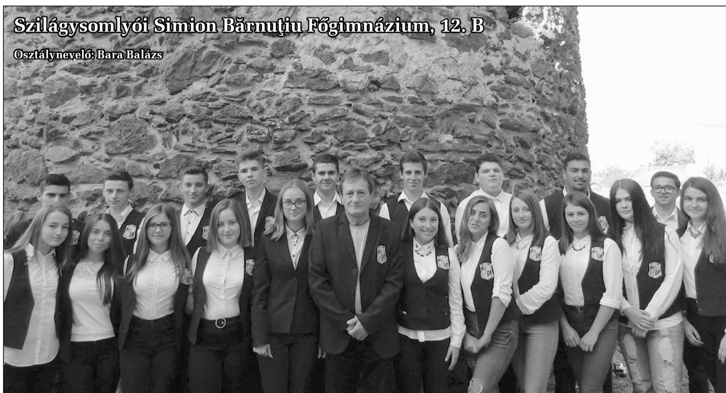
Szilágysomlyói Simion Bărnuțiu Főgimnázium, 12. B

„Legnagyobb cél pedig, itt, e földi létben, / Ember lenni mindég, minden körülményben.” (Arany János)