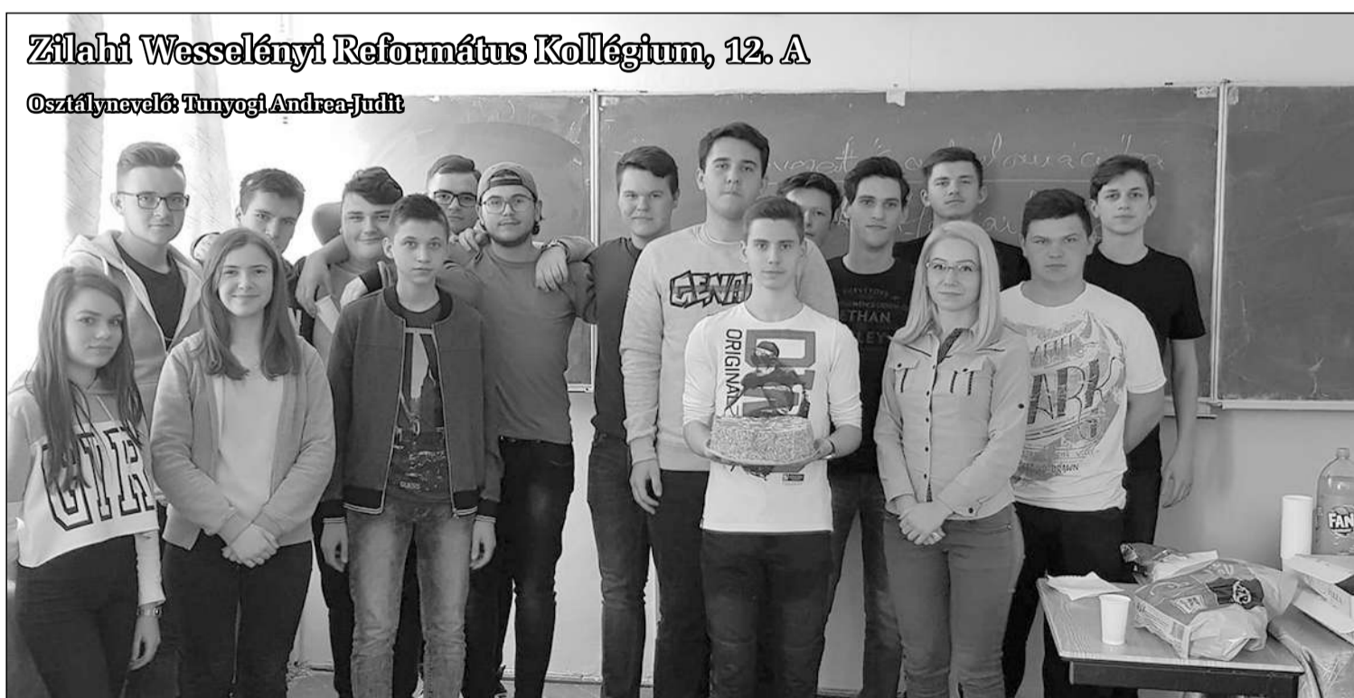
„Nem kívánom senkitől, / hogy csodás dolgot tegyen, / de joggal elvárom mindenkitől, / hogy mindig ember legyen.” (Ady Endre)