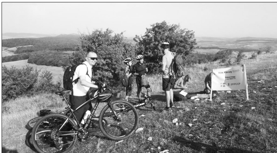
A túrázó kerékpárosok átlagéletkora 33 és fél év volt