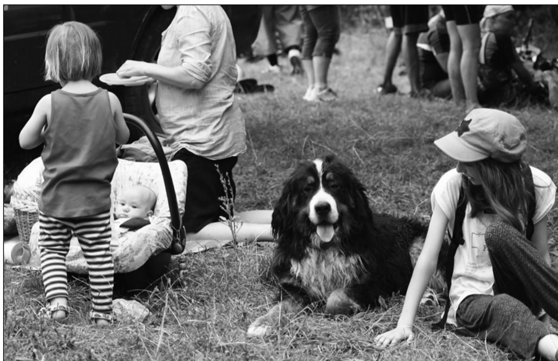
Túrós puliszkára várva a Szentimrei-villánál