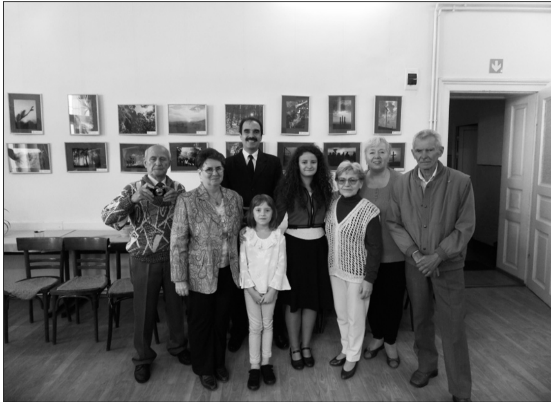
Házigazdák, fotósok és vendégeik. Október végéig látható Hidelvén az EKE fotóklubjának tárlata.