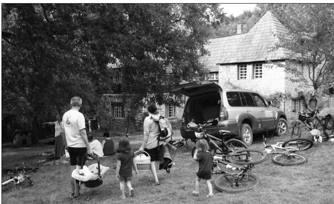
Több mint húsz család jött túrázni