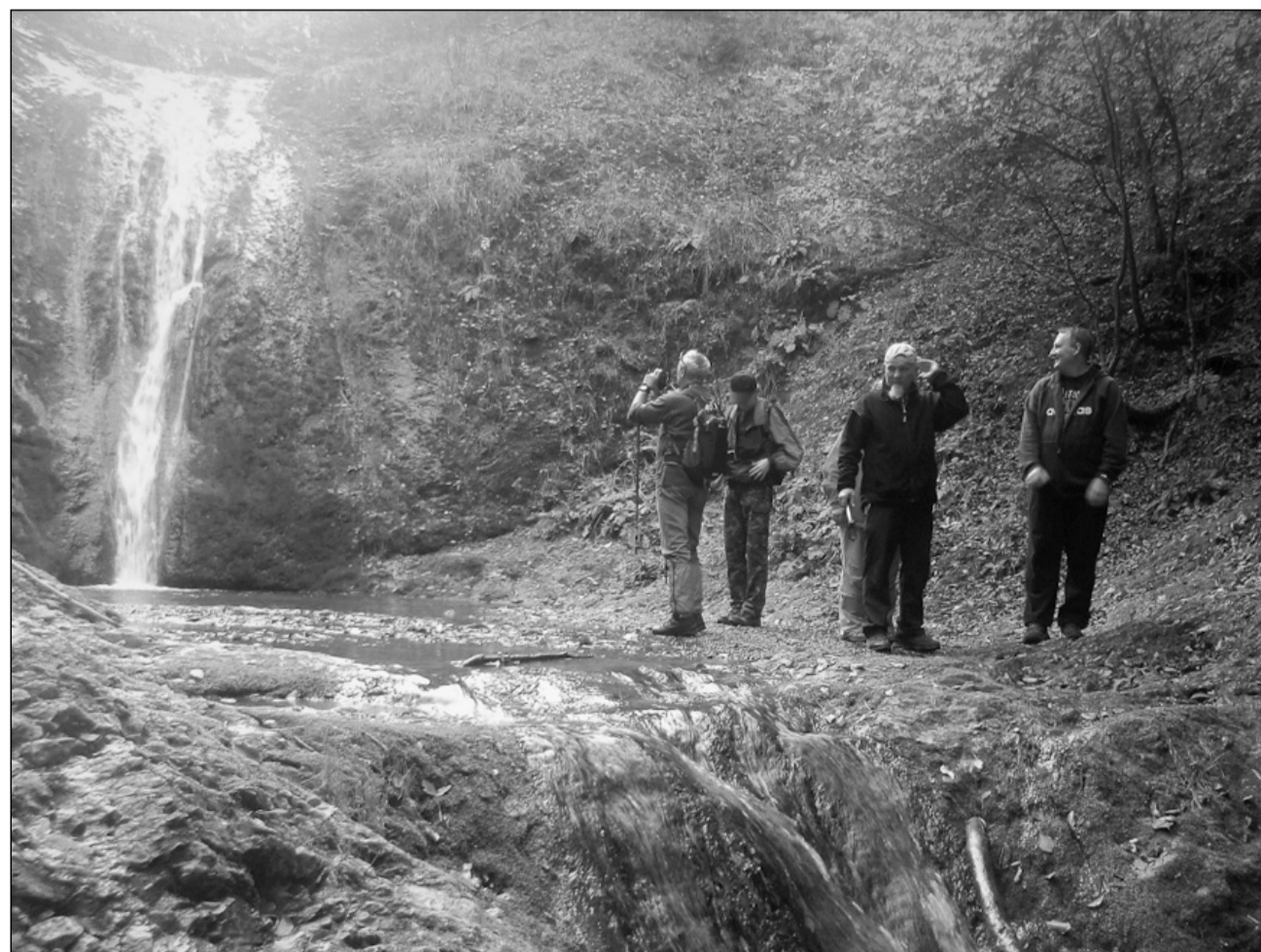
A patak hét vízesése közül az Ökrök a leglátványosabb

Nemsokára elérjük az Ökrök-völgye feletti kilátó szikláit. Alattunk a Boiului-patak völgye, körbe erdők, hegyek és kicsit távolabb a kanyargós Sebes-Körös. Tovább követjük a jelzést, a sziklát már jól magunk mögött hagyjuk, egy kopár dombhoz (Vârful Țipleu) érünk, majd felkapaszkodunk a tetején levő jelzőtáblához, ahonnan még egy óra az út Barátkáig. Percekig állunk, csodálva a szép körpanorámát, az erdők tarka színeit az őszi napsütésben. A jelzés innen meredeken levezet az Ökrök-völgye bejáratához. Mi a kilátó melletti székérúton ereszkedünk le Barátkára, bezárva így körtúránkat és a délutáni vonattal utazunk vissza Kolozsvárra.