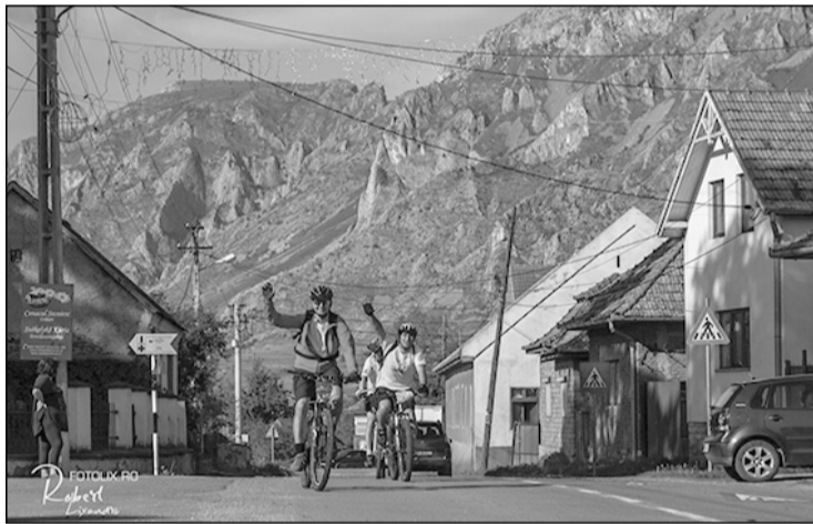
Közel már a cél (Jókai túra, 2017)

Az ellenőrzőpontoknál folyadékot biztosítanak, Szinden és Várfalván hideg, Torockón pedig meleg ételt, a Gy55 és Kerékpárostúra változatokon résztvevők energiacsomagot is kapnak. Az előzetes nevezések határideje május 7. 12 óra, ezután már NEM lehet benevezni. Kedvezményes nevezési (és fizetési) határidő: április 29. 24 óra. Kései nevezési időszak: április 30, 0 óra–május 7. 12 óra. Annak, aki a kedvezményes nevezési időszakban nevezett be, de a kedvezményes fizetési határidőig NEM fizette be a részvételi költségeket, ezt követően már a kései nevezési időszakban érvényes részvételi költségeket kell befizetnie. A benevezők által fizetendő részvételi költségek kifizetésének igazolása (fizetési bizonylat) legkésőbb május 7-én 12 óráig be kell érkezzen a szervezőkhöz. Ellenkező esetben május 8-án reggelig töröljük a benevezőt a nevezési listáról.