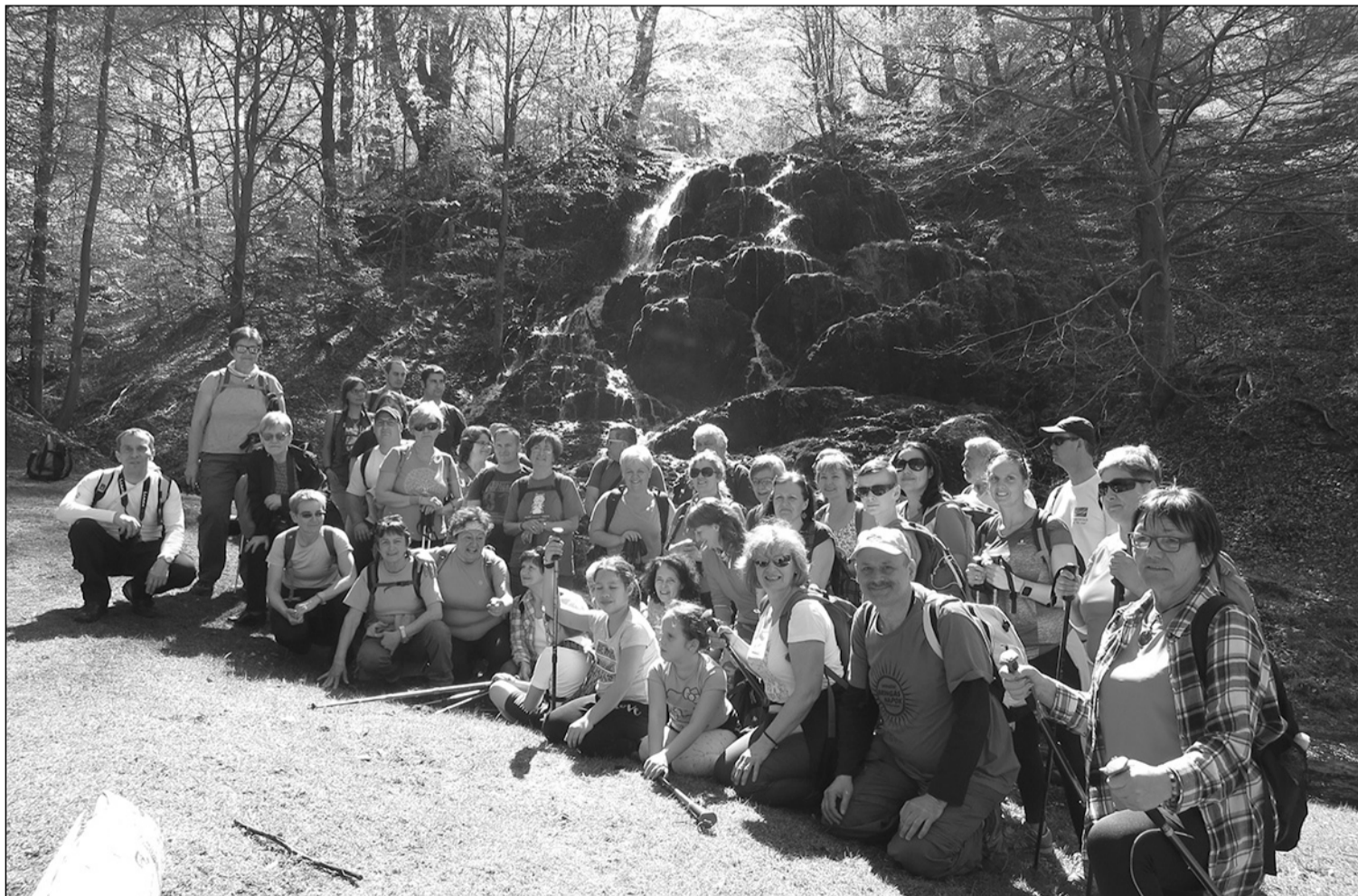
A vízesés hozama másodpercenként mintegy 80 liter

Valkó várából leereszkedve elbúcsúztunk vendégeinktől, akik meghívtak minket egy négy napos Zaránd-hegységi közös túrára pünkösdkor.