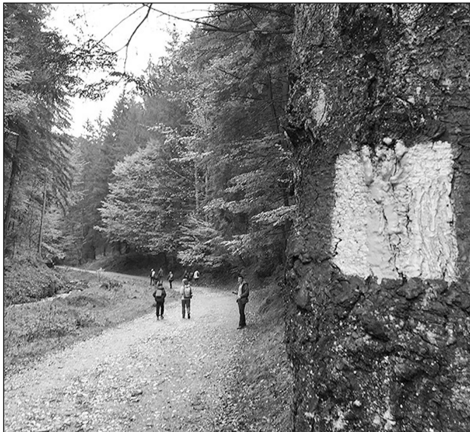
Úton a Hétlétrák felé

Sok ismerettel gazdagabban várjuk a projekt során következő további két nemzetközi találkozókat, 2021-ben először Lengyelországban, végül pedig Erdélyben.