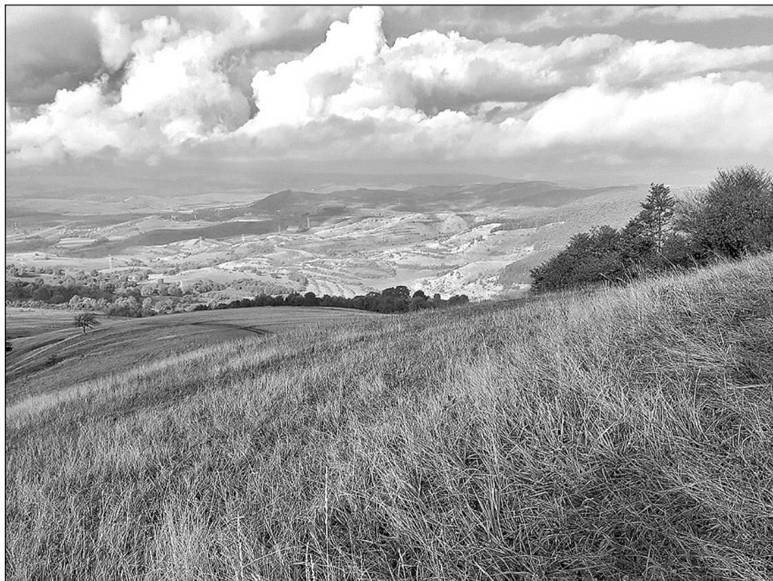
Kilátás a Havas-bükkéről

Mivel az útitervünkben nincs benne sem a vízesés, sem az EKE-forrás, az erdőben haladó útról nyugati irányba, az erdő felső széle felé átvágunk a fák között, elérjük a plató szélét, az erdőben pedig őzlábgombát szedünk. Az erdőszélen folytatjuk utunkat északi irányba, eljutunk egy bekerített telekhez, amelyen magányos ház áll. Innen az út több irányba ágazik, déli irányba lejtő vezet a Kolozstótfalu feletti legelőkre. Felhős az idő, a kilátást a Szamos-völgye felé eltakarja a köd, csak sejteni lehet a Gorbó-gerinc és a Leányvár kettős dombjának körvonalát. Nem ereszkedünk le a völgy felé, hanem elhaladunk a magányos ház előtt nyugati irány-